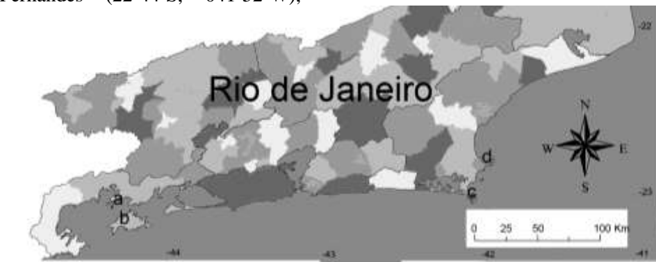
Figura 1: Áreas de estudo: a) Praia do Tanguá, Angra dos Reis; b) Praia de Araçatiba, Angra dos Reis; c) Praia do Forno, Arraial do Cabo; d) Praia de João Fernandes, Búzios, Brasil.