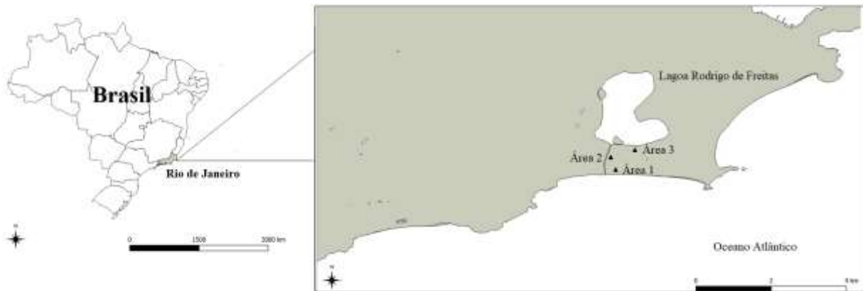
Figura 1 – Localização das três áreas de estudo: Praia de Ipanema (Área 1), canal do Jardim de Alah (Área 2) e Lagoa Rodrigo de Freitas (Área 3)

pessoas constantemente (Souza & Azevedo, 2020). A lagoa sofreu um reflorestamento de flora nativa de manguezal, além de plantio de vegetação junto às pavimentações, que inclui hibiscos e amendoeiras.